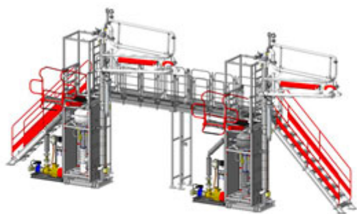
АСН-8ВГ НОРД Ду100 2/2 (КМ-СМФ-300) ХЛ2

Система измерительная верхнего дозированного налива светлых нефтепродуктов в автоцистерны с обеспечением коммерческого учета в объемных (и массовых единицах при установке массового расходомера) АСН-8ВГ НОРД Ду100 2/2 в комплектации объемными счетчиками или массовыми расходомерами, с насосами, с входными лестницами и перекидными трапами, обслуживающая два отсека а/ц с одной стороны наливного островка.