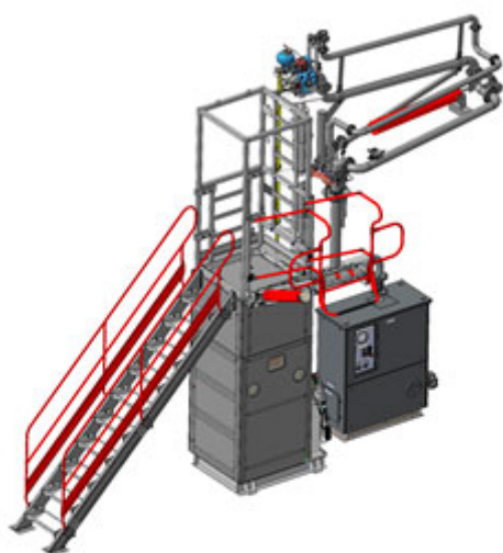
АСН-12ВГ НОРД Ду100 1/1 (КМ-ШВ) со станцией насосной КАСКАД в эл. обогревном кожухе

Система измерительная верхнего дозированного налива светлых нефтепродуктов в автоцистерны с обеспечением коммерческого учета в объемных (и массовых единицах при установке массового расходомера) с электрообогревом основных узлов АСН-12ВГ НОРД Ду100 1/2 с возможностью налива 2-х продуктов через один стояк без смешивания в комплектации объемными счетчиками или массовыми расходомерами, с насосом, с входной лестницей и перекидным трапом, обслуживающая один отсек а/ц с одной стороны наливного островка.