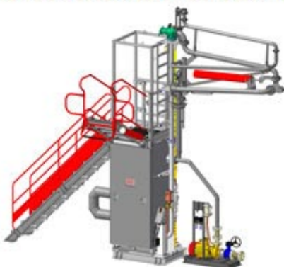
АСН-12ВГ Модуль Ду100 (КМ – SMF-300) Х12

Система измерительная верхнего дозированного налива светлых нефтепродуктов в автоцистерны с обеспечением коммерческого учета в объемных (и массовых единицах при установке массового расходомера) АСН-12ВГ Модуль Ду100 в комплектации объемным счетчиком или массовым расходомером, с насосом, с входной лестницей и перекидным трапом, обслуживающая один отсек а/ц с одной стороны наливного островка.