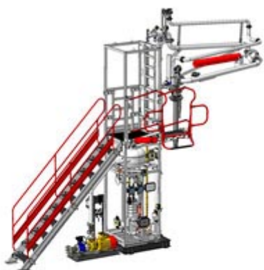
АСН-12ВГ Модуль Ду100 (КМ-ППВ) У2

Система измерительная верхнего дозированного налива светлых нефтепродуктов в автоцистерны с обеспечением коммерческого учета в объемных (и массовых единицах при установке массового расходомера) АСН-12ВГ Модуль Ду100 в комплектации объемным счетчиком или массовым расходомером, с насосом, с входной лестницей и перекидным трапом, обслуживающая один отсек а/ц с одной стороны наливного островка.